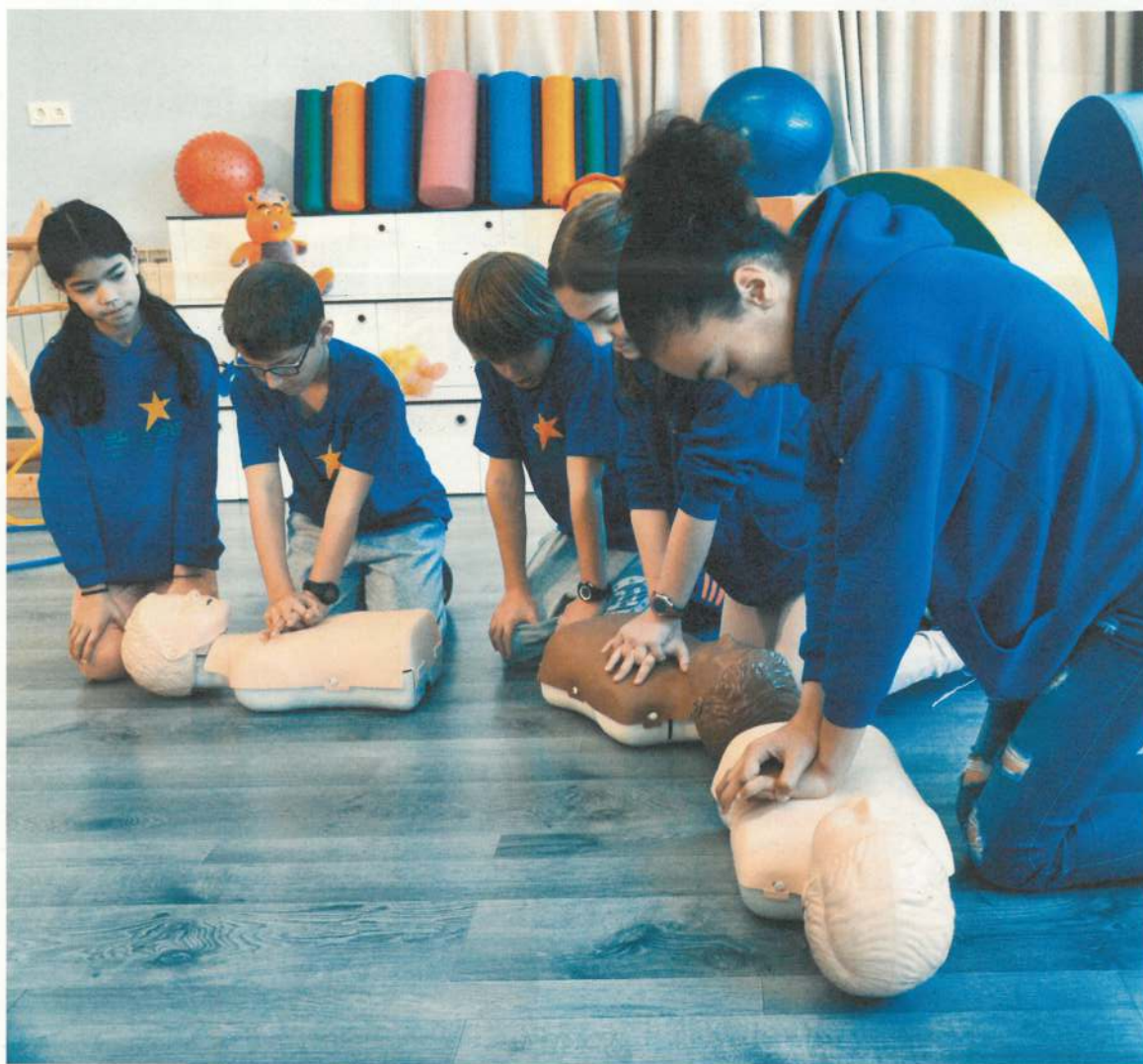
Gracias a la colaboración de personas generosas como tú, el futuro de DYA Gipuzkoa está asegurado.

Que guipuzcoanos y guipuzcoanas sois personas generosas es una buena noticia que viene repitiéndose de manera ininterrumpida desde 1973.